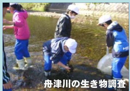
舟津川の生き物調査