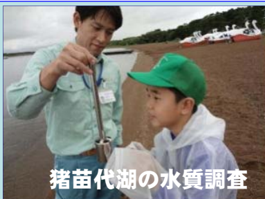
猪苗代湖の水質調査