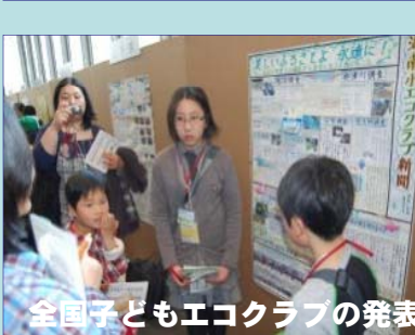
全国子どもエコクラブの発表