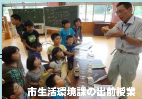
市生活環境課の出前授業