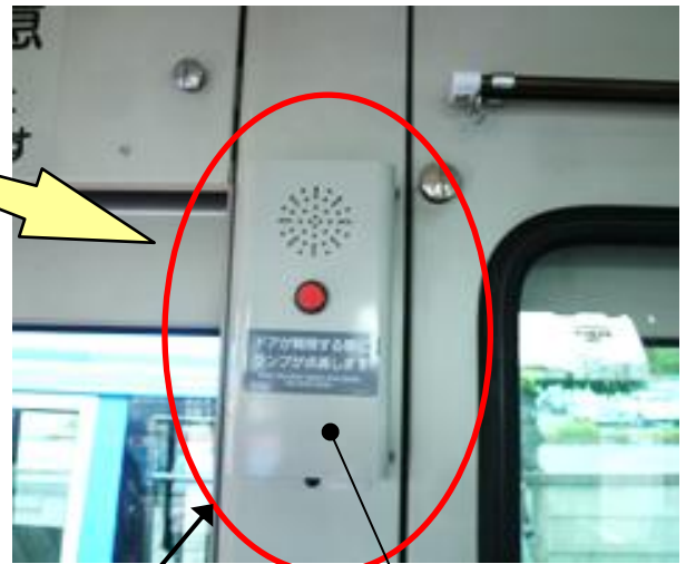
音声合成式 扉開閉予告装置 (制御プログラム)