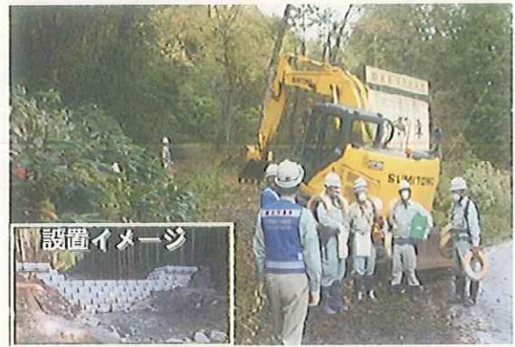
堰堤設置作業に着手 (10/4)