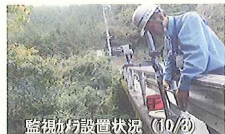
監視カメラ設置状況 (10/3)

降雨による土石流を監視するため、長野県と連携のうえ監視カメラとワイヤーセンサーを濁 にごり 沢川、湯川、冷川、鹿ノ瀬川、白川 しらかわ に設置し、地元自治体等への緊急連絡体制を確保。(10/4)