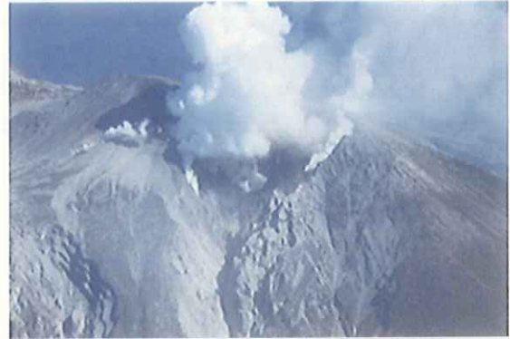
噴火の状況(9/29)

9月27日に発生し、多くの被害をもたらした御嶽山の噴火に対して、国土交通省では、噴火後直ちに体制をとり、27日14時25分には太田大臣が登庁され、入山者の救助に総力を上げるよう指示される等の初動対応を実施。