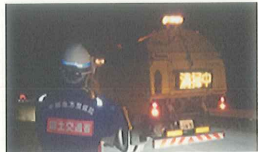
路面清掃車による降灰除去 (9/28)