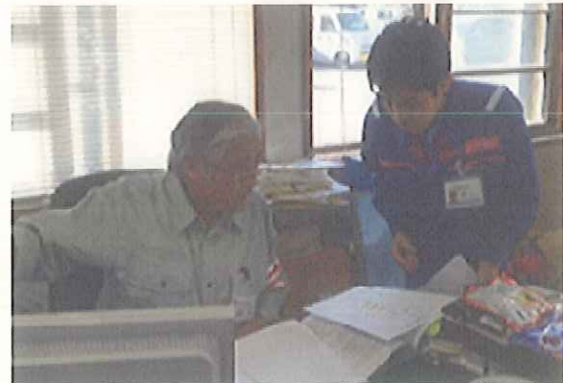
リエゾンから王滝村長に報告(9/29)

発災当日の9月27日より、中部地方整備局からリエゾンを派遣。以降、リエゾン最大11名を関係県・市町村に派遣。(長野県庁、王滝村、木曾町、岐阜県庁、高山市、下呂市)