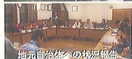
地元自治体への状況報告