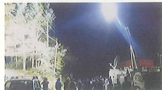
照明車で下山・救助活動支援(9/27)

○9月27日より、照明車により、徒歩下山者および自衛隊等による救助活動の支援を実施。