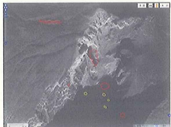
SAR 画像(赤丸が推定火口)