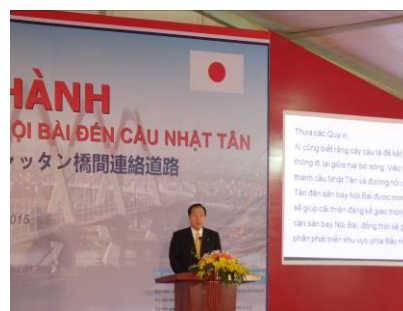
ニヤッタ橋での大臣挨拶