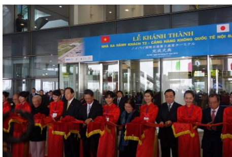
ノイバイ国際空港第二ターミナルテープカット