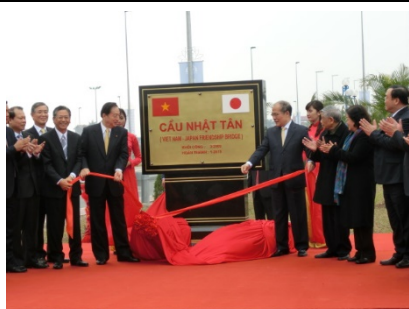
ニヤッタ橋ネームプレート設置 (フン国会議長及び太田大臣)