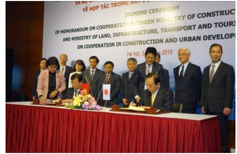
ズン建設大臣との間の協力覚書署名