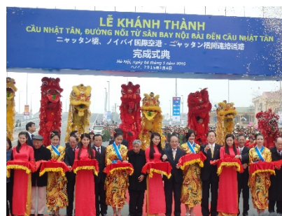
ニヤッタ橋テープカット