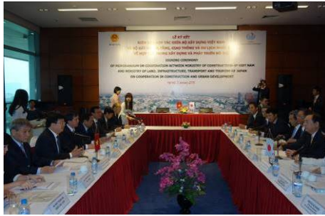
ズン建設大臣との会談