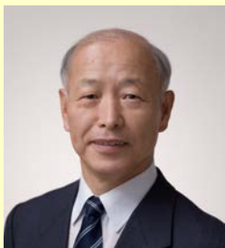
郡上市長 日置 敏明 氏