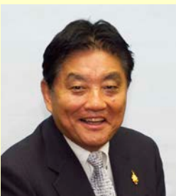
名古屋市長 河村 たかし 氏