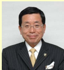
高山市長 國島 芳明 氏