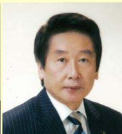
岐阜市長 細江 茂光 氏