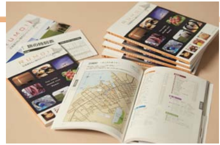
「北海道るもい管内ガイドブック」 留萌管内の食べる・泊まる・遊ぶ情報満載の観光ガイドブック。カラーマップ付。