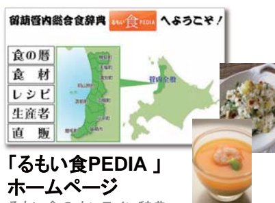
「るもい食PEDIA」 ホームページ るもい食のオンライン辞典。 留萌管内の食材をテーマに 様々なレシピを紹介。