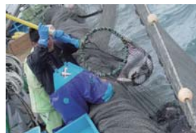
イベント開発「ひらめ底連網オーナー」ほか