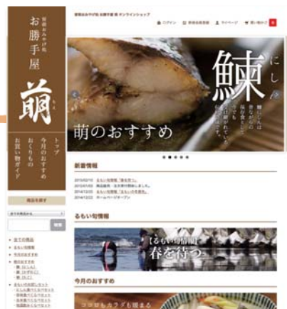
「お勝手屋 萌」ホームページ 留萌管内の通販サイト構築