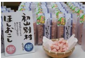
商品開発サポート(初山別・羽幌ほか)