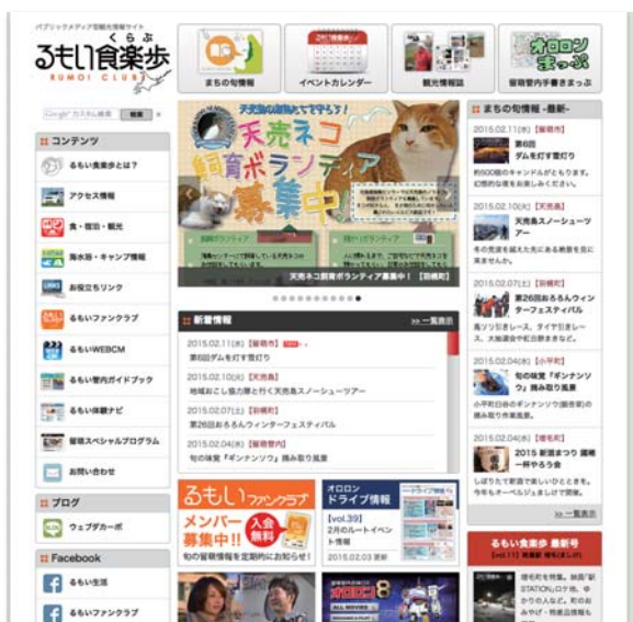
「るもい食楽歩」ホームページ 留萌管内の旬・人・まちの情報などを紹介。