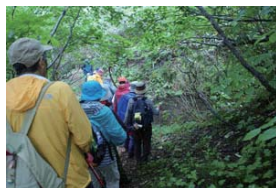
体験旅行商品の開発と運営(全管内・羽幌)