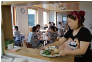
地産地食 「るもいコミュニティカフェテリア」

「るもいファンクラブ」 るもいの魅力を体験、そして順送りに 人に伝えるネットワーク。会員限定の ギフトセット販売や、限定体験会の実 施。(現在500人) るもいに関するアンケートなども実施。 旅のコーディネートも対応。