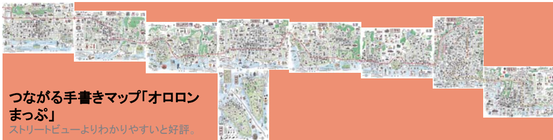
つながる手書きマップ「オロロン まっぷ」 ストリートビューよりわかりやすいと好評。