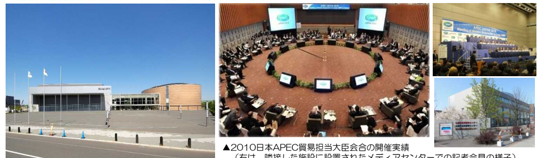
▲2010日本APEC貿易担当大臣会合の開催実績 (右は、隣接した施設に設置されたメディアセンターでの記者会見の様子)