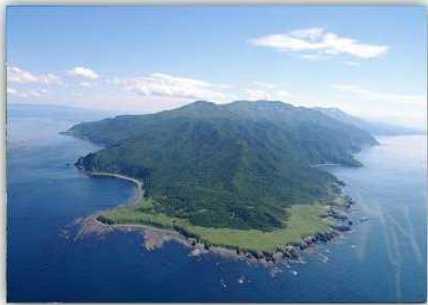
▲知床（平成17年7月 世界自然遺産に登録）