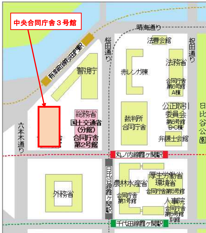
○中央合同庁舎3号館へのアクセス

住 所 〒100-8918 東京都千代田区霞が関2-1-3中央合同庁舎3号館 最 寄 駅 東京メトロ丸ノ内線・日比谷線・千代田線 霞ヶ関駅 A2、A3a、A3b出口 東京メトロ有楽町線 桜田門駅 4番出口