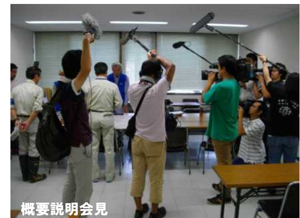
H26.9 広島県広島市 (公社)全国防災協会3名