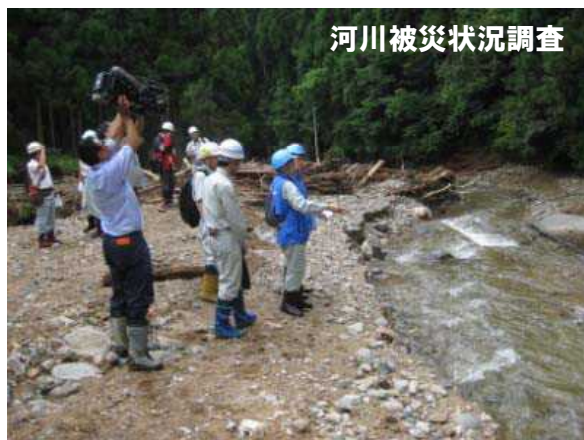
H26.7 山形県南陽市 (公社)全国防災協会2名