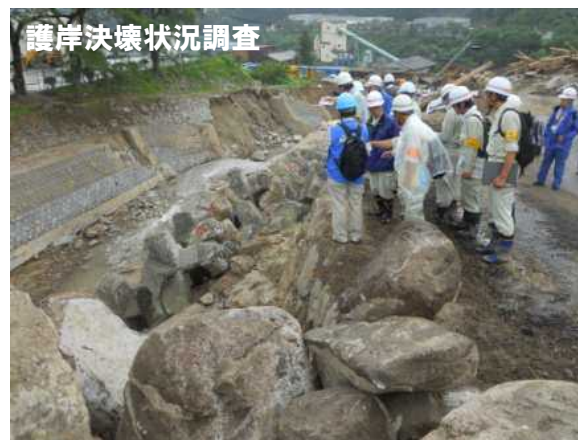
H26.7 長野県木曾郡南木曾町 (公社)全国防災協会2名