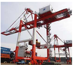
ガントリークレーン2基目増設 (H25.11)