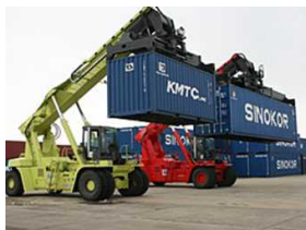
リーチスタッカー2台目導入 (H26.12)