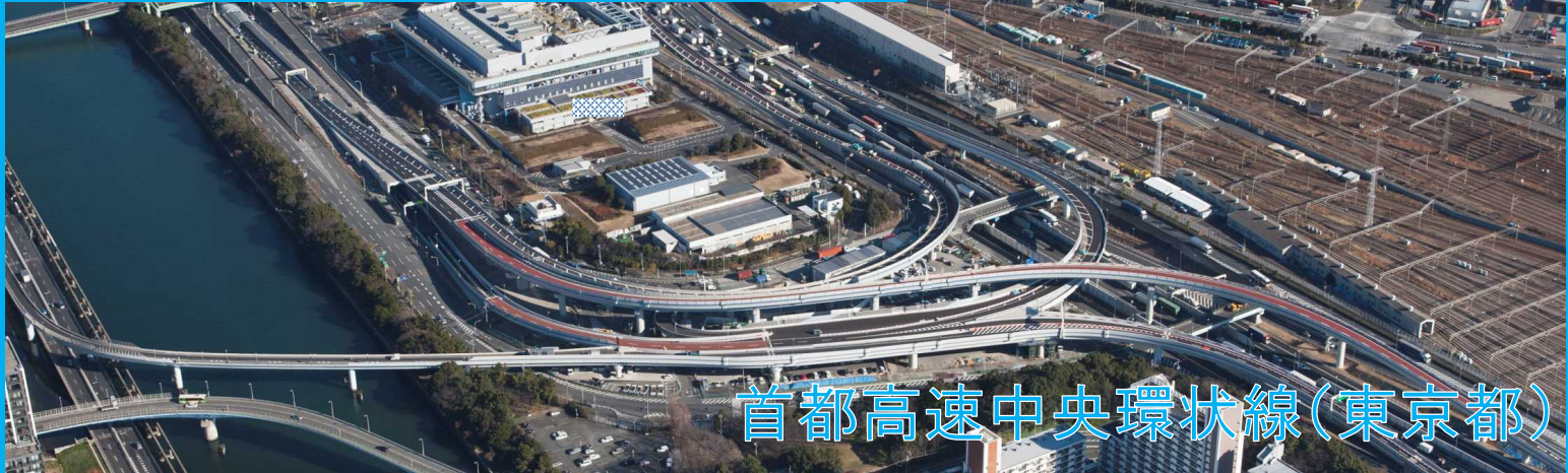
首都高速中央環状線(東京都)