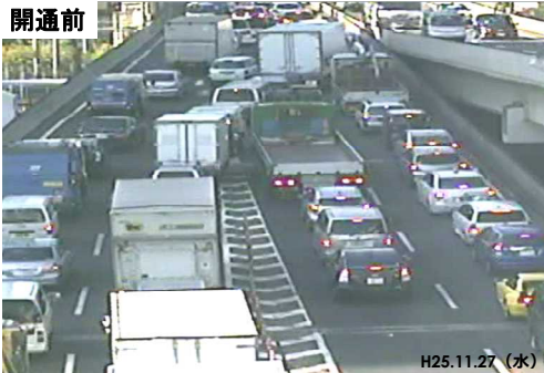
開通前後の道路状況

開通前: H26.3.10~H26.4.7、開通後: H27.3.10~H27.4.7