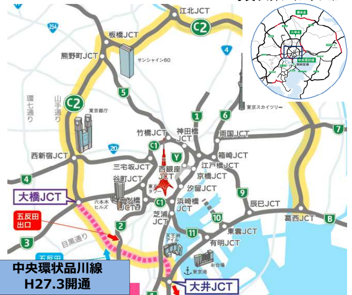
中央環状品川線 H27.3開通