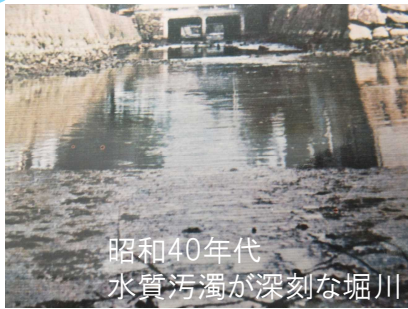
昭和40年代 水質汚濁が深刻な堀川