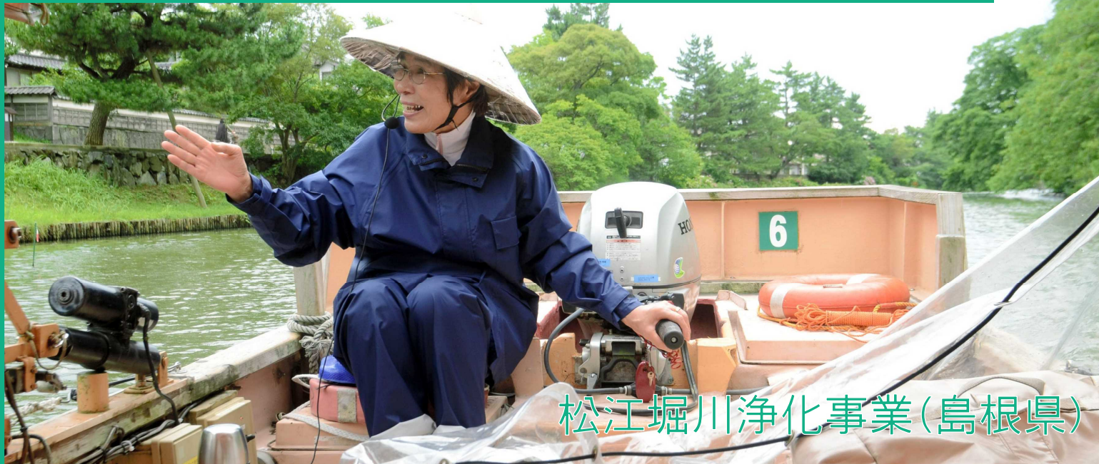
松江堀川浄化事業(島根県)