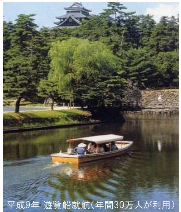
平成9年 遊覧船就航(年間30万人が利用)