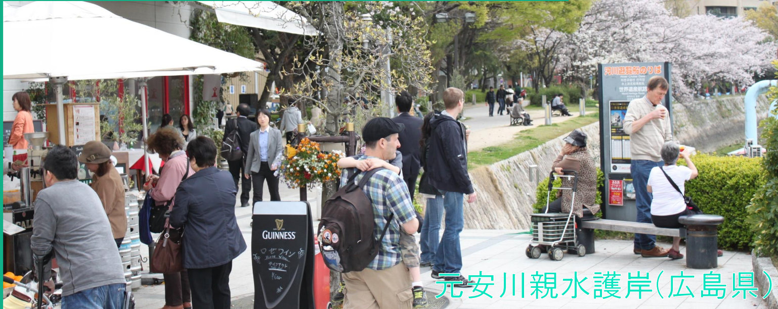
元安川親水護岸(広島県)