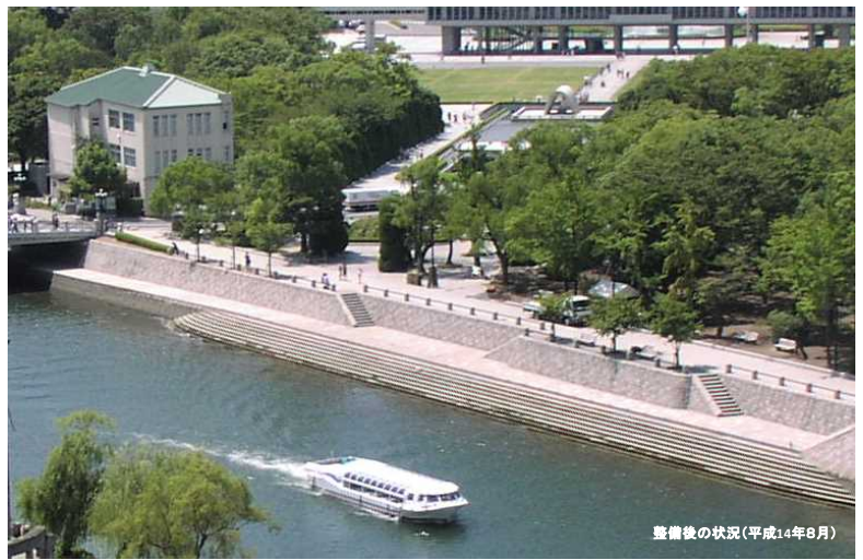
整備後の状況(平成14年8月)

■ 河川空間の利用の規制を緩和し、オープンカフェを常設し、平和記念公園の来訪者に憩いや交流の場を提供。利用者数は7万人に