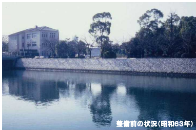
整備前の状況(昭和63年)