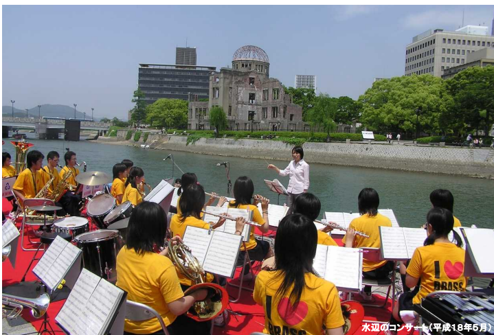
水辺のコンサート(平成18年5月)