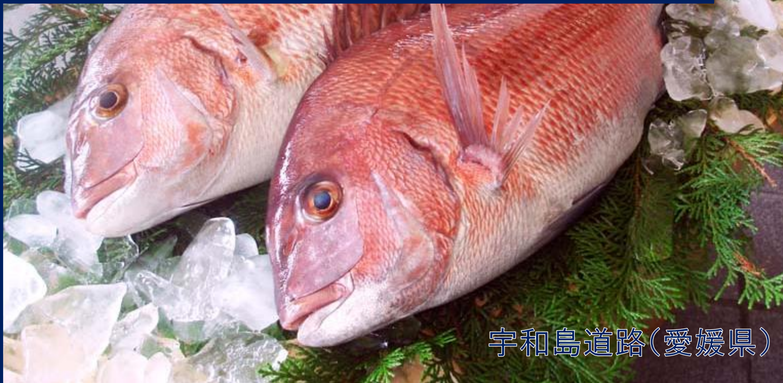
宇和島道路(愛媛県)