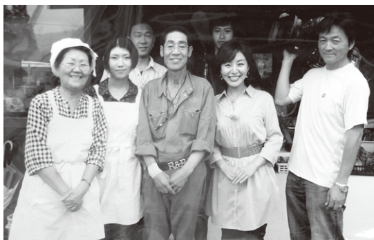
札幌テレビ放送「どさんこワイド」 (2010年7月16日放送分)でも取材をうけました。