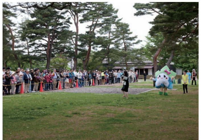
開会の模様・かくルンも登場