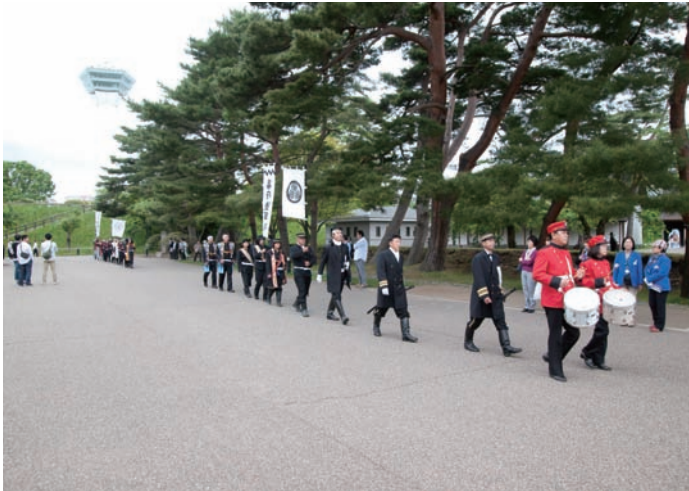
開催場所への行進風景

「箱館五稜郭祭・稜雲社」「函館野外劇・殺陣チーム」のご協力により結成し、箱館戦争時の旧幕府軍・新政府軍との壮絶な戦闘シーンを大砲の打ち合いから始まり、迫力満点で迫真の演技で、大喝采を浴びる。期間中の月2回程度で18日間・1日2回で36回開催した。