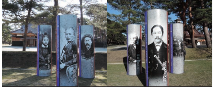
特別史跡五稜郭跡