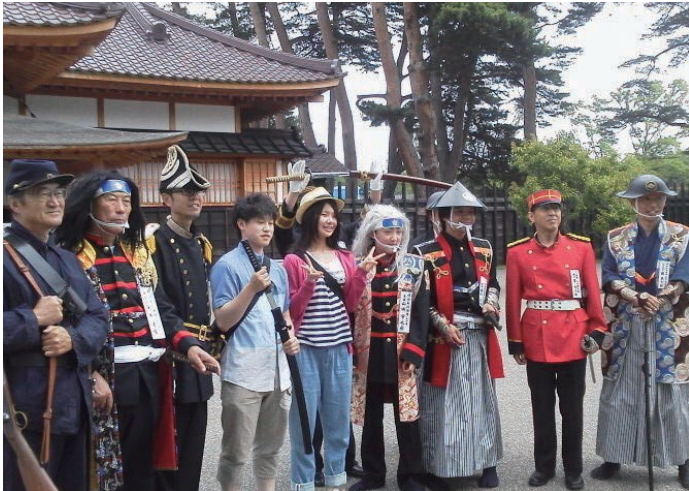
箱館奉行所をバックに観光客と記念写真撮影の数々

「商工会議所青年部」「青年会議所」「法人会青年部会」「青色申告会青年部」「建設二世会」「西部地区振興協議会」「箱館会」の7青年団体及び一般市民ボランティアの方々のご協力により結成され、期間中57日間・1日平均10名前後のメンバーにより実施された。