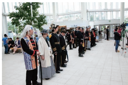
五稜郭おもてなし隊の面々