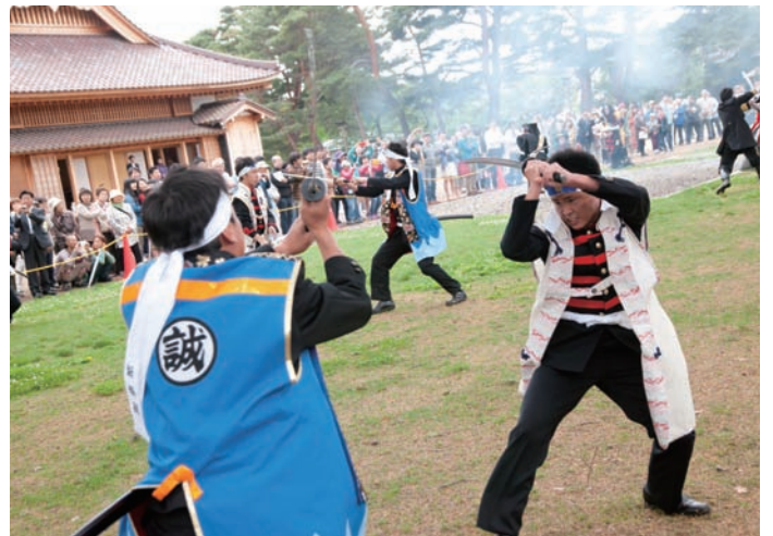
迫力の殺陣シーン