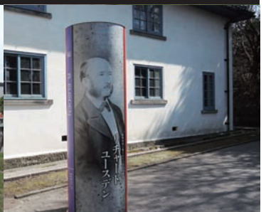
函館市旧イギリス領事館 (開港記念館)