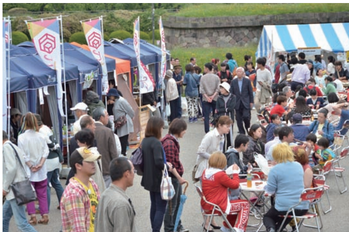
おいしい食を堪能する会場風景