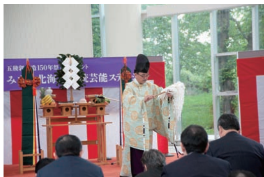
イベントの安全祈願