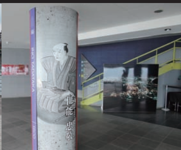
函館山ロープウェイ山頂駅