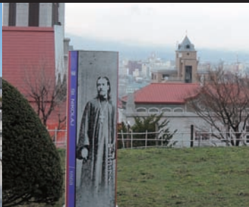
函館ハリストス正教会