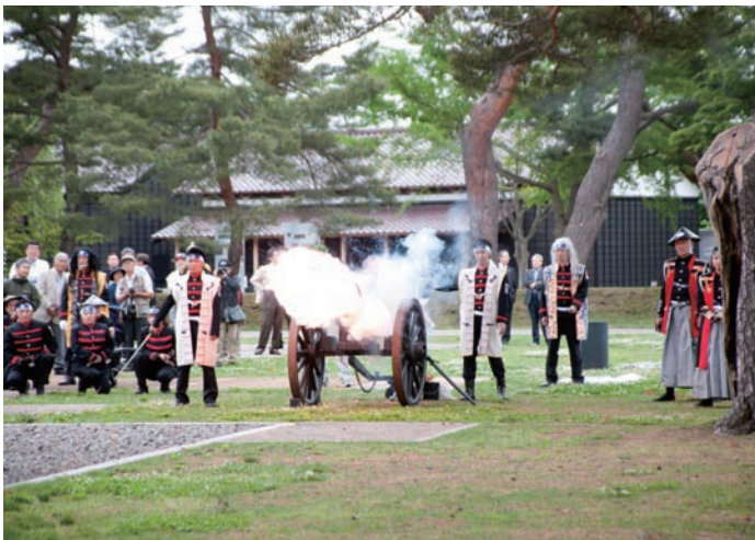
双方大砲により、いざ戦闘開始