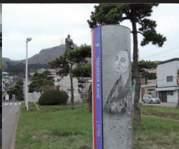
宝来町グリーンベルト