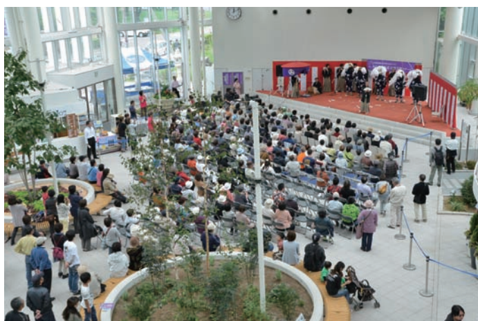
見物客で一杯の会場