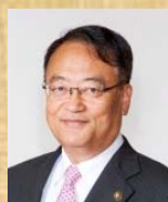
太宰府市長 芦刈 茂 氏