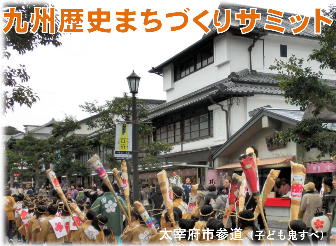
太宰府市参道（子ども鬼すべ）