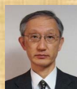
九州地方整備局長 鈴木 弘之