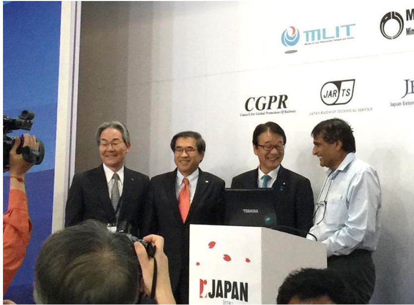
日本鉄道セミナーに参加された山本副大臣とプラブー鉄道大臣