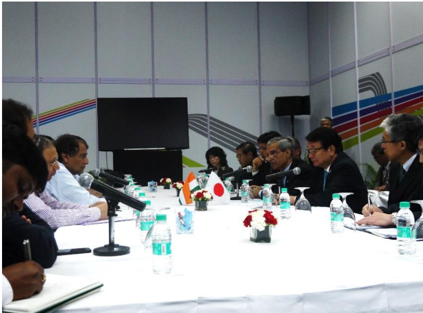
プラブー鉄道大臣との会談の様