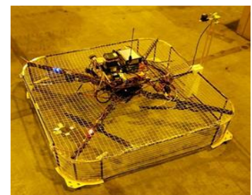
小型無人機(ドローン)タイプ