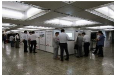
※新宿駅西口会場の様子