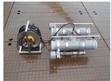
ROV (Remotely operated vehicle)