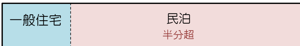
図3 民泊部分が建物全体の半分よりも大きい場合 ⇒ 建物全体が宿泊施設として取り扱われる

※ 建物全体の延べ面積が300㎡以上の場合、建物全体に自動火災報知設備の設置が必要となる。