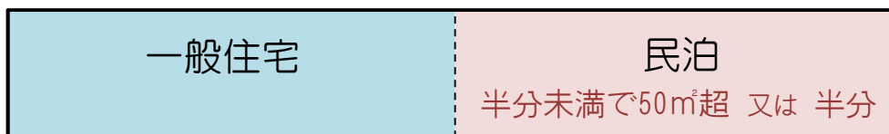
図2 民泊部分が建物全体の半分未満で50㎡超又は建物全体の半分の場合 ⇒ 建物全体が用途が混在する防火対象物として取り扱われる