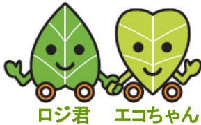
ロジ君 エコちゃん