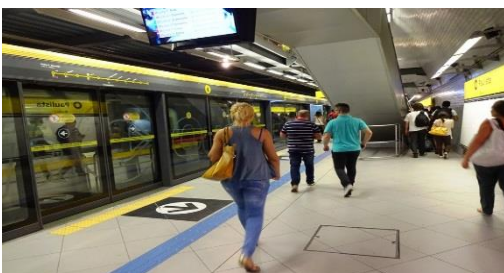
現行のサンパウロ地下鉄4号線駅構内

沿線の通学需要に応えるため、また、交通渋滞等を解消するため、6 号線を整備・運営し、輸送力の増強を図る事業。