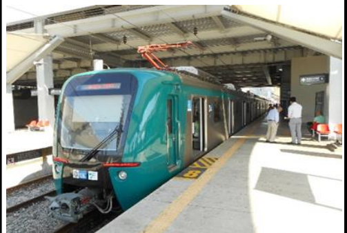
運行中の鉄道車両

車両・レールの交換、システムの維持・管理等に投資し、安全性・安定性の向上を図り、慢性的な交通渋滞の解消につなげることを目的とする事業。