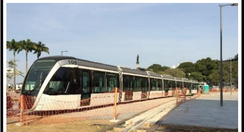
リオデジャネイロ LRT(展示車両)

2016 年のリオ五輪開催に向けて、空港や港湾との連結性を高めるため、LRT を整備・運営し、輸送力の増強を図る事業。