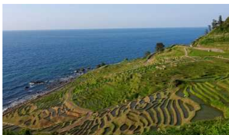
美しい農村の景観