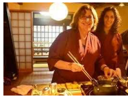
日本食の料理作り体験

「日本の歴史・文化伝統体験」に関心の高い欧米豪からの旅行者に対し、地方の歴史的・文化的な資源の体験を訴求