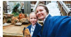
10 Japanese hot springs that foreign travelers shouldn't miss!

Here is a ranking of hot springs most popular with overseas tourists in 2015 by Rakuten Travel. What's #1? Read on to find out! http://travel.rakuten.com/campaign/ranking/...n-inbound/