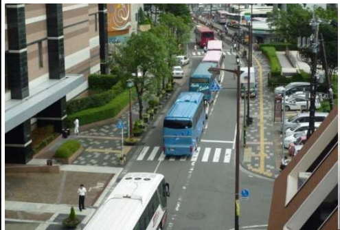
駐車場待ちの車列