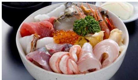
地域ならではの食を堪能