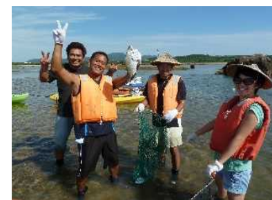
魅力ある観光地の創造