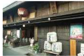
飛騨高山の酒蔵巡り