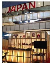
旅行博覧会 出展 (フランス)