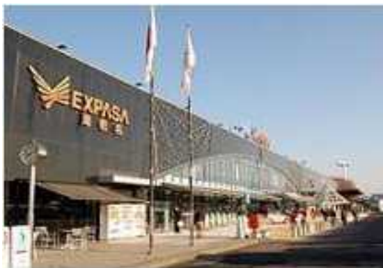
ターミナル駅やSA等での 空室情報発信