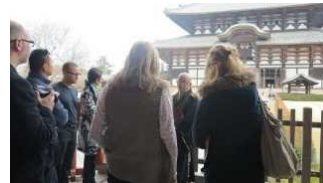
東大寺の特別拝観