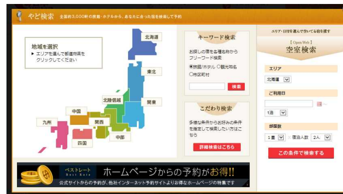
例) 日本旅館協会運営予約サイト「やど日本」