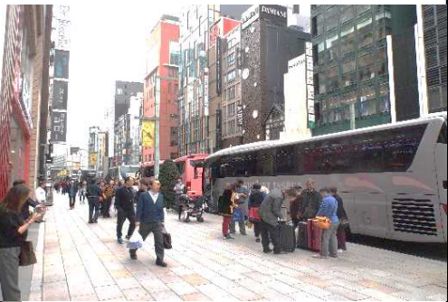
乗客乗降待ちの車列