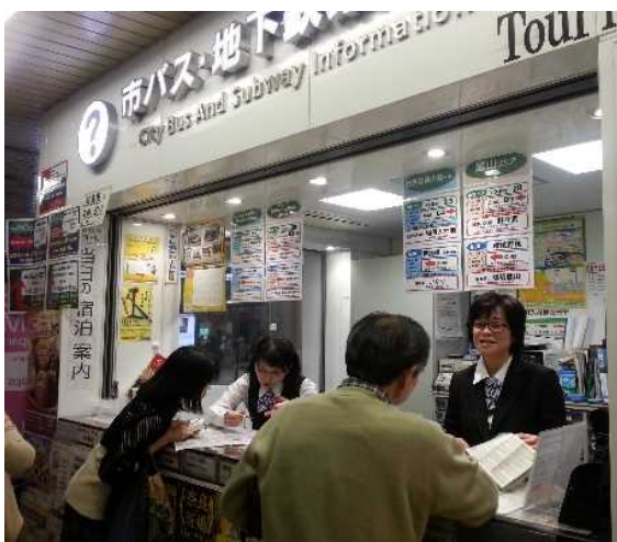
観光案内所での 空室情報集約・提供