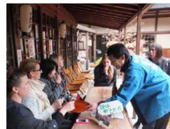
メディア招請(豪州)