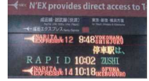
事業者ごとに分けられた受付カウンターや案内表示