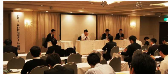
【パネルディスカッション】