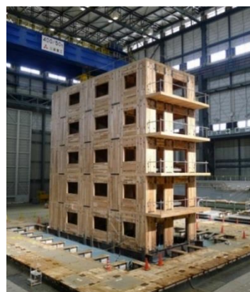
図2 実大震動台実験の様子