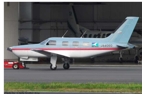
パイパー式PA-46-350P型主要諸元