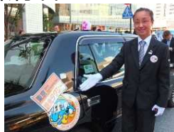
東京観光タクシー