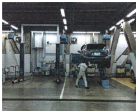
整備作業場(一般整備)