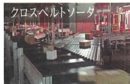
クロスベルトソータ

従来施設の2倍の処理能力と底面をスライドさせる仕分け方法により、より安全な仕分けが可能とします。