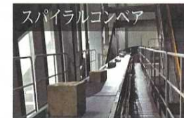
スパイラルコンベア

上層階で流通加工した荷物を仕分けエリアに直結させることで作業時間を短縮し、高品質化とスピードアップを実現します。