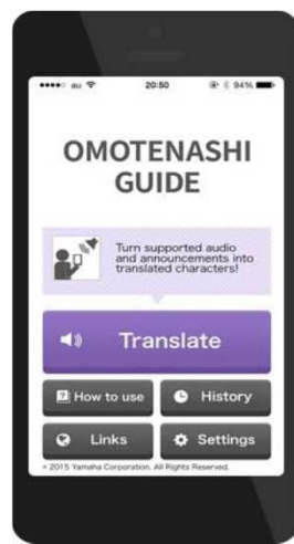
おもてなしガイド