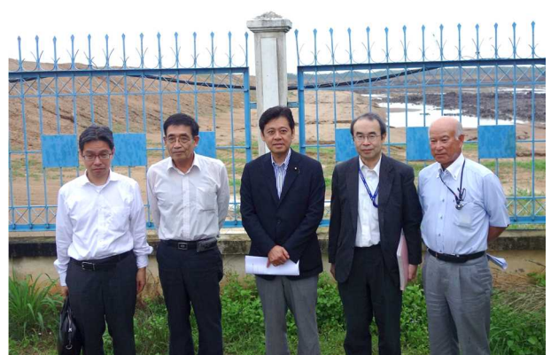
チーバイ港施工現場