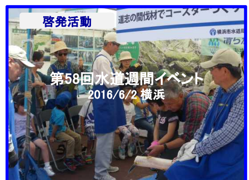
水源かん養林の大切さを市民のみなさんへ