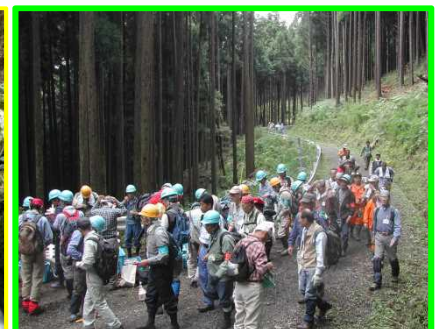
水源林の間伐活動へ