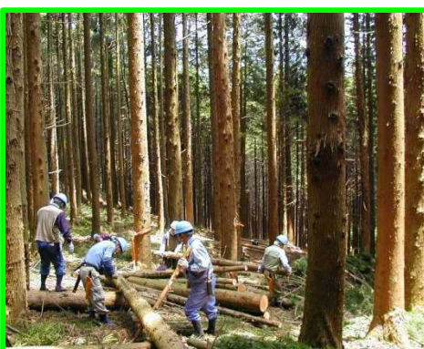
班に分かれて担当エリアを整備 作業は《安全第一》