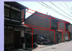
[歴史的建造物の滅失状況] (石川県金沢市)