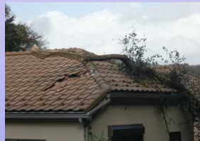
[倒木による家屋への被害] (鎌倉市)