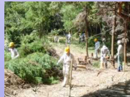
[ボランティア団体の活動状況] (奈良市)