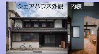
[民間主体による歴史文化資産の活用] (滋賀県長浜市)