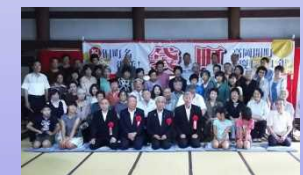
[旧町名の復活] (富山県高岡市)