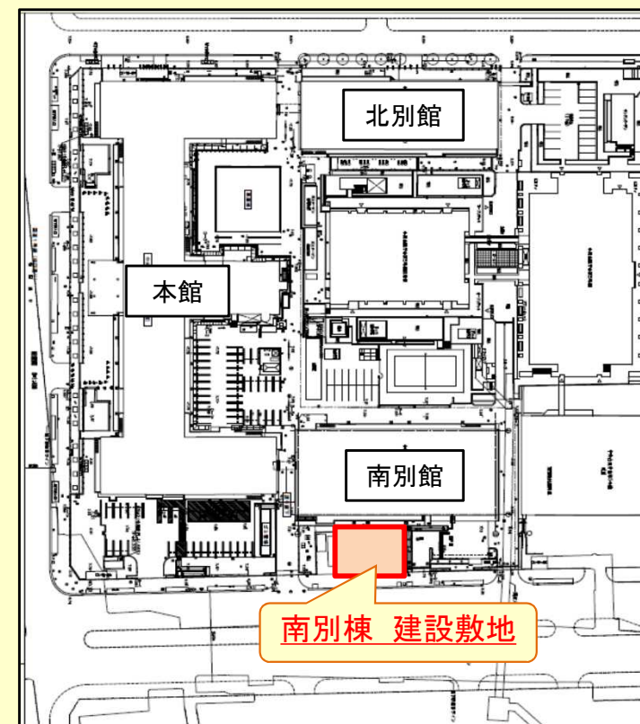
中央合同庁舎第1号館 配置図

用途：保育所等 事業期間：H27設計 H28工事 構造規模：木造平屋建 面積：247㎡