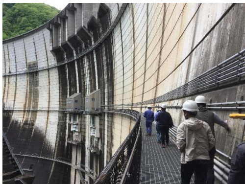
点検設備見学(川治ダム)