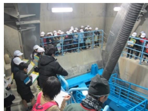
放流設備見学(苦田ダム)