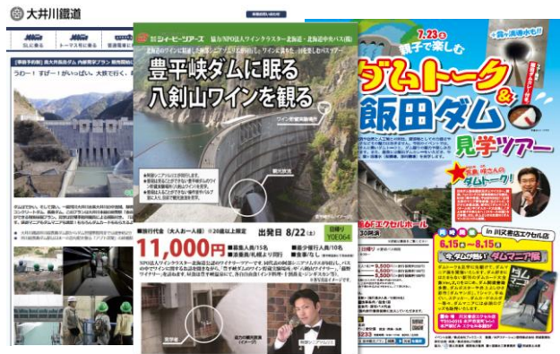
民間ツアーの広告