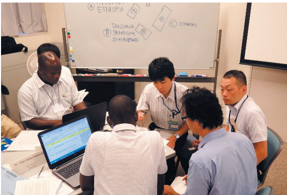
パワートレインチームの能力アップ研修の様子