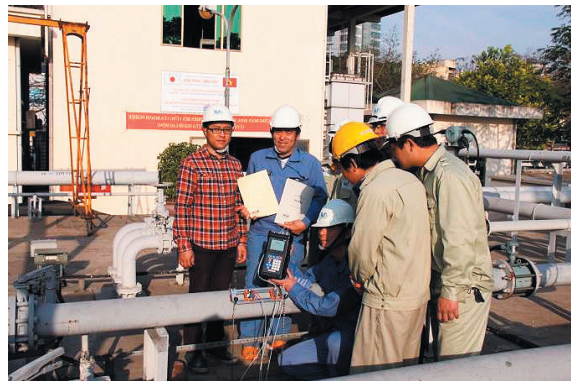
ベトナム国ハノイ市における技術研修