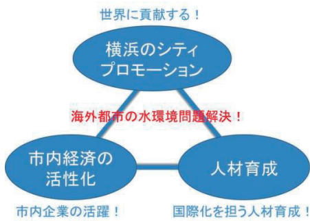
横浜市国際貢献活動の目的