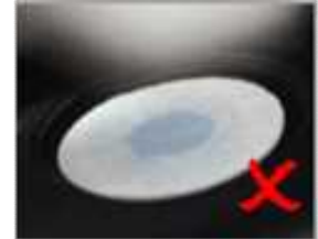
フィルタ 防水性 NG