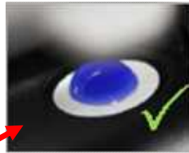
フィルタ 防水性 OK