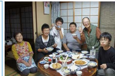
農家などで島暮らしの体験ができる「民泊」