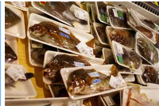
鮮魚の直売所の様子