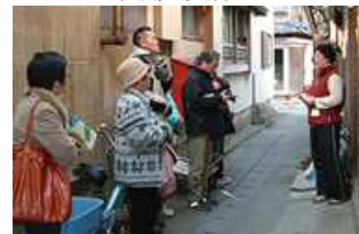
路地裏つまみ食い体験の様子 （出典）島の旅社HP