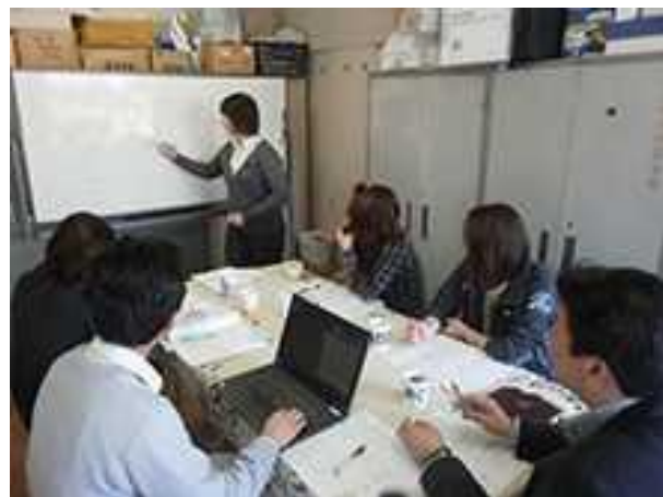
NPOによる住民向けの勉強会の様子 (出典) きらりよしじまネットワーク webサイト

(出典) 特定非営利活動法人きらりよしじまネットワークwebサイト, http://www.e-yoshijima.org/project/training.php , 2016/01/08, 閲覧 DRIVE webサイト, 世帯加入率100%! まちづくりNPOが創る、山形県川西町での新しい住民自治のカタチ, http://www.etic.or.jp/drive/labo/6948 , 2016/01/08, 閲覧