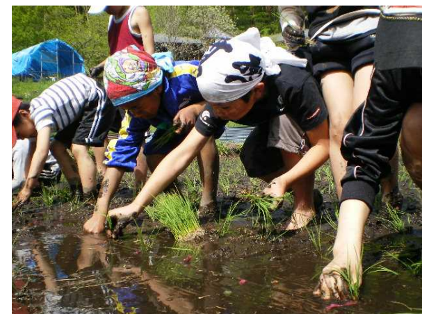
田植えの様子