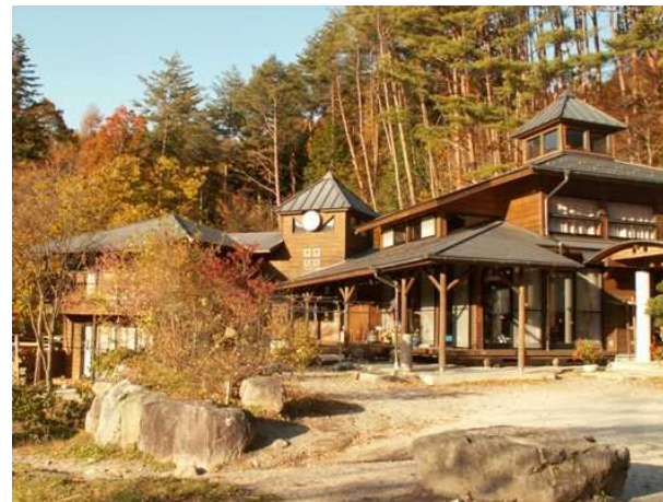
寮施設外観

（出典）NPO法人なみあい育遊会HP, http://www.mis.janis.or.jp/~namiyou/ , 2015/12/31, 閲覧 阿智村、阿智村過疎地域自立促進計画（平成28年度～平成32年度）