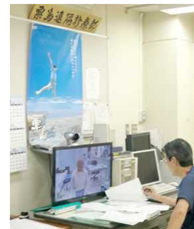
TV診療の様子(本土)

(出典) 国土交通省、離島振興の近年の取組事例, http://www.mlit.go.jp/common/001025903.pdf , 2015/12/28, 閲覧 総務省、粟島の未来 ふるさと粟島を次世代に継承, http://www.soumu.go.jp/main_content/000166445.pdf , 2015/12/28, 閲覧 三浦・渡部・中山・板垣・他、粟島へき地出張診療所における看護活動, 厚生連医誌第13巻1号, pp.47-48, 2004 村上総合病院HP, http://www.mgh.jp/awashima/ , 2015/12/28, 閲覧