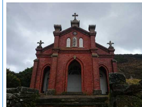
旧野首協会(野崎島)