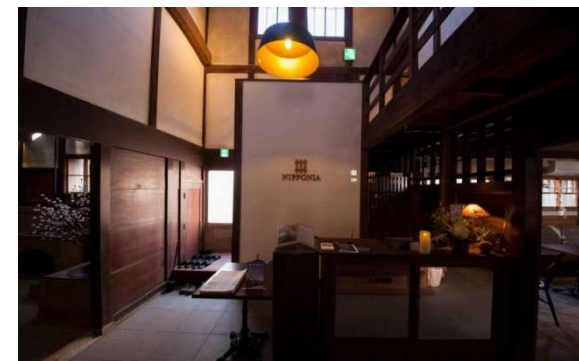
宿泊施設のフロント