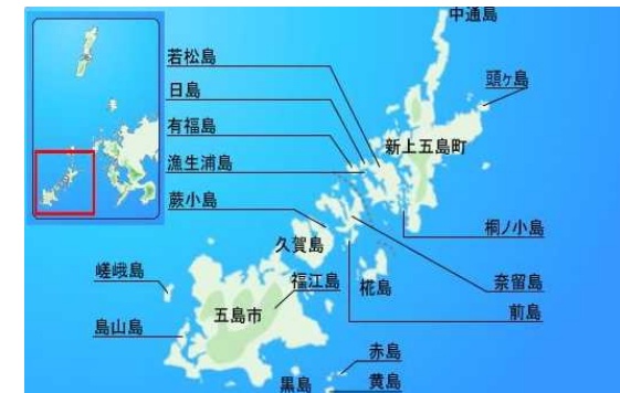
五島列島の配置

(出典) 国土交通省、離島振興の近年の取組事例, http://www.mlit.go.jp/common/001025903.pdf , 2016/01/09, 閲覧 五島列島赤島の旅赤島の家, http://copine.ciao.jp/Galerie/g27akasima1.html , 2016/01/09, 閲覧 ながさきの[しま]webサイト, http://www.pref.nagasaki.jp/sima/index.html , 2016/01/11, 閲覧