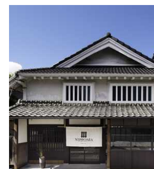
宿泊施設