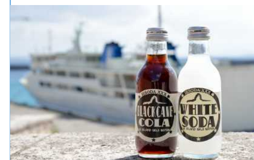
イエソーダ