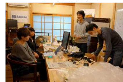
古民家を活用したサテライト オフィス内の様子 20

(出典) クラウドWatch, 事例紹介, 初の人口社会増、相次ぐ視察—地方創生「神山の奇跡」はなぜ起きた?, http://cloud.watch.impress.co.jp/docs/case/20150522_700175.html , 2016/01/05, 閲覧 野田邦弘, 徳島県神山町〜クリエイティブ人材を誘致する驚異の「創造的過疎」の地域づくり〜 イン神山HP, http://www.in-kamiyama.jp/ , 2015/01/05, 閲覧 全国町村会HP, ~神山町と特定非営利活動法人グリーンパレーの歩み~, http://zck.or.jp/forum/forum/2841/2841.htm , 2016/01/06, 閲覧