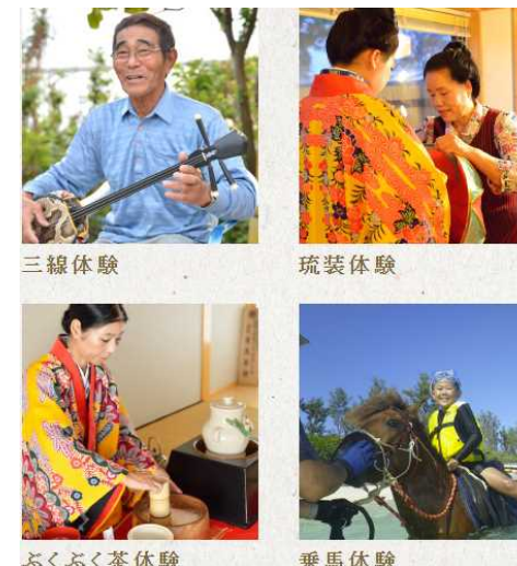
体験プログラムの一部