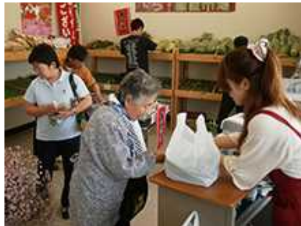
産直市の様子