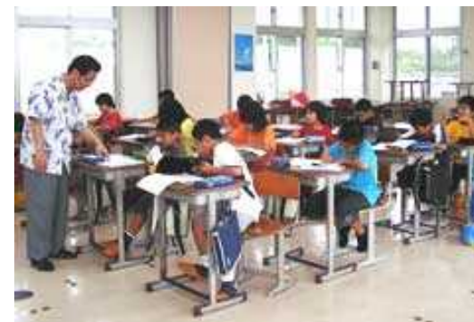
村営塾の様子