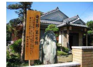
改修した古民家

(出典) 経済社会総合研究所, 地域活性化システム論カリキュラム研究会報告書, 地域活性化事例, 鹿児島県鹿屋市串良町柳谷地区 住民の参加意欲醸成による集落の活性化—やねだん 補助金にたよらない地域づくり—, p111-112, 2012年3月 やねだん (鹿児島県鹿屋市串良町柳谷地区) webサイト, http://www.yanedan.com/ , 2016/01/08, 閲覧 明治学院大学社会学部社会学科教授浅川達人研究室HP, やねだんに学べ, http://www.asakawa.skr.jp/AsaLABOnew/yanedanni_xuebe.html , 2016/01/08, 閲覧