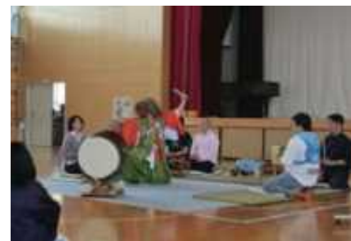
地域学の例

(出典) 島前高校魅力化プロジェクトwebサイト, http://miriyokuka.dozen.ed.jp/ , 2016,01,17, 閲覧 富永木実, 海士町にみる「地域づくり」の本質, 地域イノベーション (5), pp.65-78, 法政大学地域研究センター, 2012 岩本裕, 教育の魅力化による地域の活性化～人づくりからのまちづくり～隠岐島前高校魅力化プロジェクトの事例, 山陰中央新報, 2011 島根県立隠岐島前高校ウェブサイト, http://www.dozen.ed.jp/pamphlet/ , 2016/01/25, 閲覧 島根県隠岐島前高校, ときどききらきら島留学学校案内2015