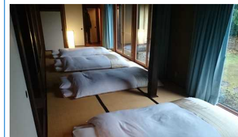
古民家ステイの宿