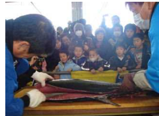
ブランド化した対馬産クロマグロの 解体ショーの様子 (出典) 長崎県webサイト

(出典) 経済産業省東北経済産業局、「地域経済活性化に貢献する産学官金連携・協働活動の促進に関する調査」報告書 第3章先進事例調査 クロマグロや水産練り製品のブランド化事業を十八銀行が主導,2011年6月