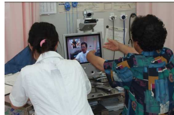
TV診療の様子(粟島)