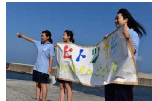
生徒による島外との交流