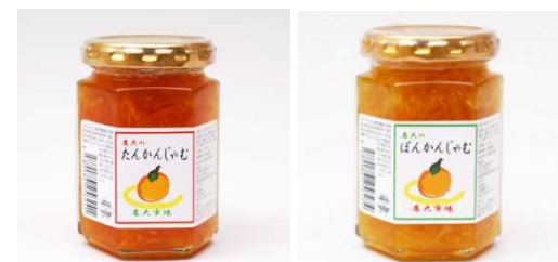
タンカンジャムとポンカンジャム