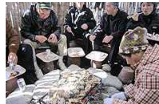
海女小屋での昼食の様子

（注）「寝屋子制度」とは、中学を卒業した男子数人が一定期間「寝屋親」の家で過ごし、その後生涯の兄弟、親子の絆を結ぶもの。全国でも答志島の答志地区にのみ残る制度。