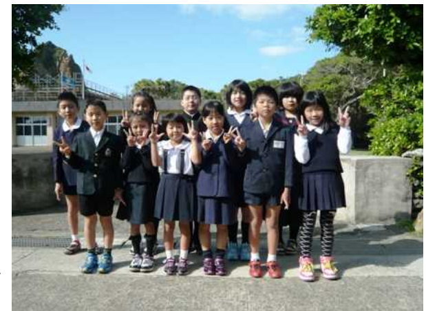
小宝島小中学校への留学生たち