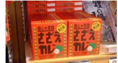
商品化されたさざえカレー

（出典） 富永木実，海士町にみる「地域づくり」の本質，地域イノベーション（5），pp.65-78，法政大学地域研究センター，2012 総務省，平成20年度優良事例集，地域資源を活用したまちづくり（島根県海士町） 海士町オフィシャルサイト， http://www.town.ama.shimane.jp/ ，2016/01/10，閲覧