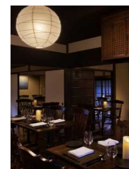
レストラン (出典)NIPPONIA WEBサイト

出典：コロカル：投資ファンドで実現する古民家再生の未来， http://nipponiastay.jp/news-20151103.html ，2015/12/14閲覧