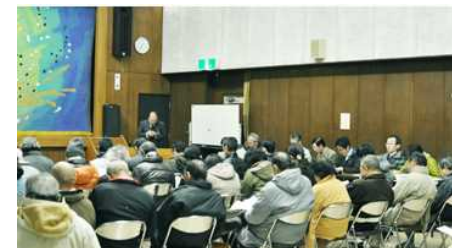
住民社員が集結した合同会社設立総会の様子 (出典) 「あば村宣言」webサイト