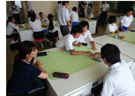
キャリア教育でのワークショップの様子