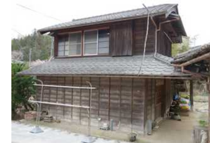
古民家を活用したサテライトオフィス