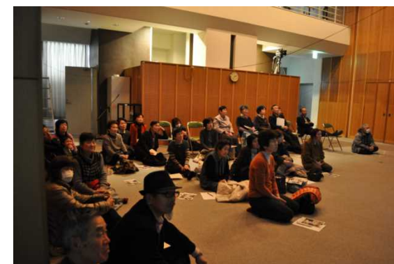
利賀村公民館で開催された利賀むら文化祭での 上映会の様子

(出典) 文部科学省, 学習環境の向上に資する学校施設の複合化の在り方について～学びの場を拠点とした地域の振興を目指して～, p. 43-44., 2015年11月 利賀中学校webサイト, http://www.tym.ed.jp/sc313/ , 2016/01/16, 閲覧 南砺市webサイト, http://www.city.nanto.toyama.jp/cms-sypher/www/section/detail.jsp?id=180 , 2016/01/16, 閲覧 映画「ふるさとがえり」 地域上映会事務局, http://www.hurusatogaeri.com/news/2014/03/post-20.php , 2016/01/17, 閲覧