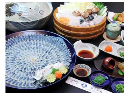
旅館でのふぐ料理