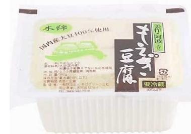
あばの水でつくる手作り豆腐

(出典) 国土交通省、平成27年2月12日「小さな拠点づくりフォーラム」資料、あば村宣言と「小さな拠点づくり」財団法人あばグリーン公社「あば村宣言」webサイト、 http://abamura.com/ 、20160106、閲覧 ジャパン・フォー・サステナビリティwebサイト、ニュースレター「会社組織で村を復活 岡山県津山市「合同会社あば村」の取組み」、 http://www.japanfs.org/ja/news/archives/news_id035350.html 、20160106、閲覧