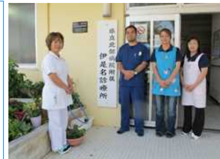
離島診療所と派遣医師・看護師