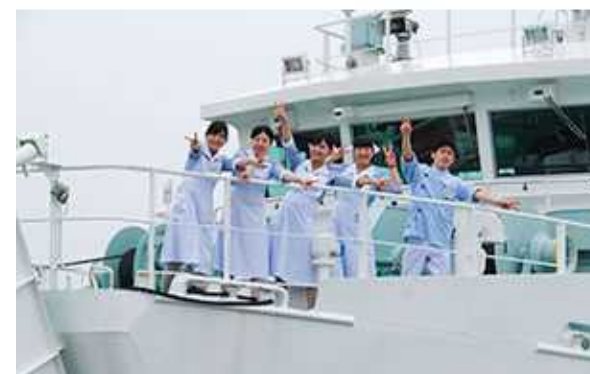
（上）船舶での診療の様子 （下）船舶とそのスタッフ