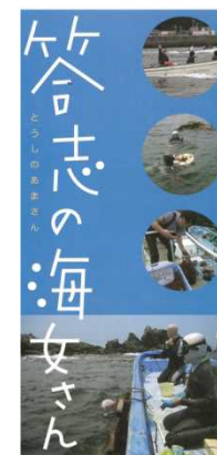
答志島の海女さんを取り上げたパンフレット