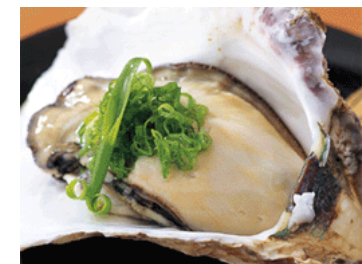
海士産の岩がき