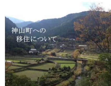
移住情報提供ウェブサイト上の広告 (出典) イン神山HP