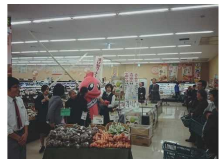
新潟市内での販売実習