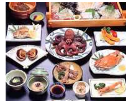
旅館でのタコ料理