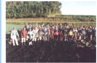
サツマイモ畑と住民