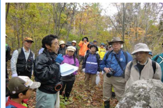
溪流紅葉ウォーキングの様子 (出典) NPO法人体験村・たのはた Facebookページ