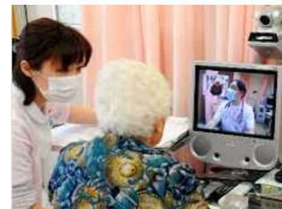
ドクターコムによる遠隔医療の様子