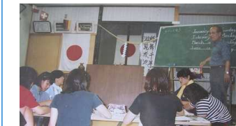
子供の補習塾の様子