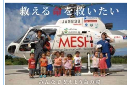
民間ドクターヘリMESH