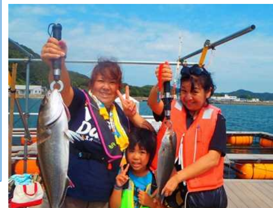
海上釣り堀の様子

出典：瀬戸山玄, 「道の駅への出品と海上釣り堀の解説で活気づく宗像大島」, 季刊『しま』, No.241, 2015年3月