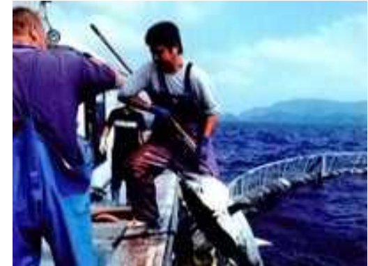
対馬島での養殖マグロ水揚げの様子