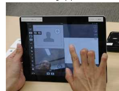
ドクターコムの運用の様子