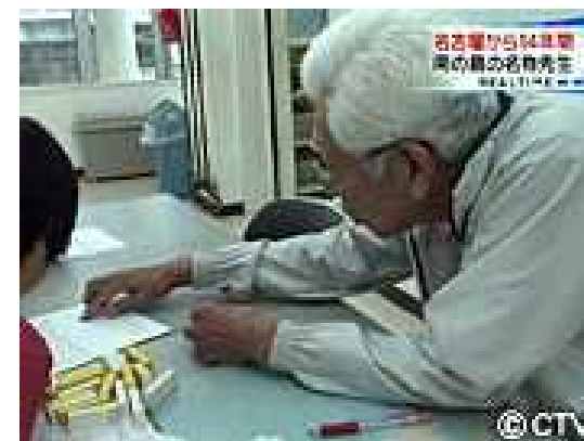
元教師の塾講師が指導する様子

(出典) 北大東村HP, http://vill.kitadaito.okinawa.jp/index.php?id=18 , 2015/12/31, 閲覧 北大東村, 北大東村総合計画2012-21, 2012年11月 北大東村, H24年度対米請求権地域振興事業報告, 2013年12月 琉球新報HP, 離島教育に情熱 北大東村なかよし塾, http://ryukyushimpo.jp/photo/preentry-24263.html , 2016/01/03, 閲覧 中京テレビHP, 特集「沖縄の離島に14名物先生!最後の授業」, http://www.ctv.co.jp/realtime/sp_kikaku/2007/05/0522/index2.html , 2015/12/31, 閲覧