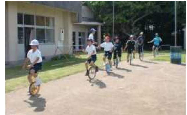
小宝島小中学校の児童の様子 (出典) 十島村立宝島小中学校小宝島分校 webサイト

(出典) 国土交通省, 平成25年度新しい離島振興施策に関する調査業務報告書 十島村立宝島小中学校小宝島分校webサイト, http://www.toshima-sc.net/kodakara/index.html , 2016/01/09, 閲覧