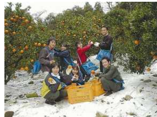
タンカン農家で大学生が作業補助をする様子