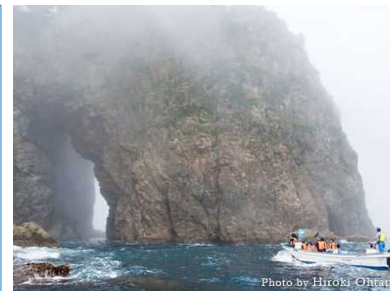
サッパ船アドベンチャーズの様子