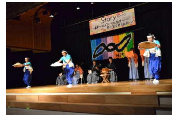
小中合同学習発表会