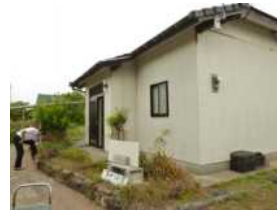
滞在交流施設「赤島の家」