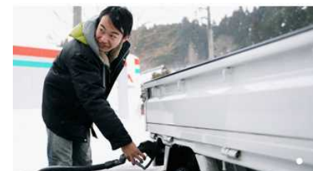
ガソリンスタンドの様子