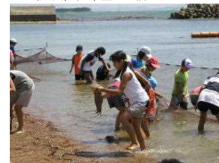
タコつかみどり 5