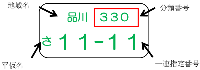
<ナンバープレートの表示内容>