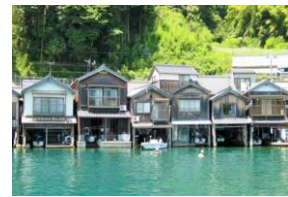
舟屋をカフェ・宿に改装して運営(伊根 油屋の舟屋「雅」)