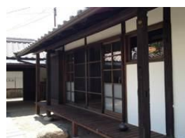
古民家を宿泊施設に改装して運営(明日香村おもてなしファンド)