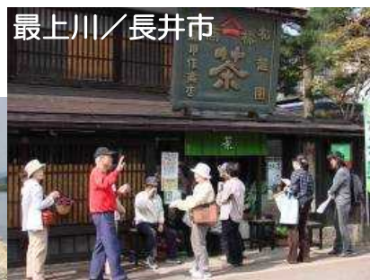
管理用通路をフットパスとして活用 (最上川)