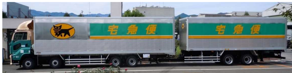
【ダブル連結トラック(21m)】