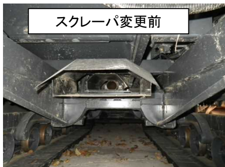
スクレーパ変更前