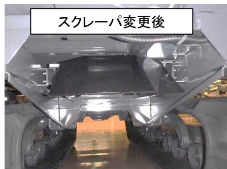
スクレーパ変更後