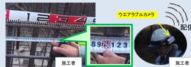
施工者が出来形を撮影し監督職員へ配信

「監督職員の目の代わりに映像で確認できないか？施工者が確認時に撮影すれば省力化できるはず！」