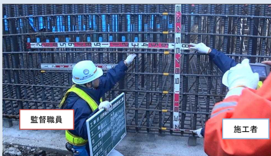
監督職員が現場に臨場して出来形を計測