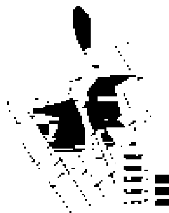
< 災害危険度判定調査の例 >