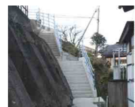
避難場所に向かう避難通路(階段)