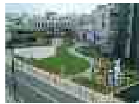
避難場所となる公園