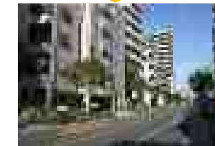
沿道建築物の不燃化 整備後