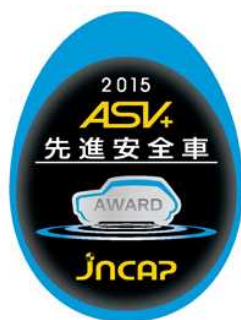
予防安全性能アセスメント 評価ロゴ

http://www.nasva.go.jp/mamoru/active_safety_search/