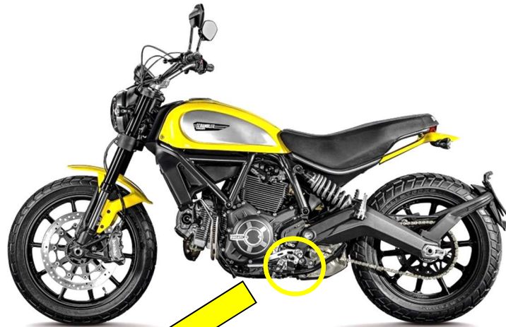
サイドスタンドブラケット