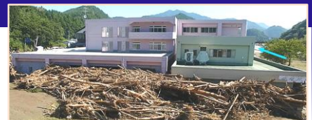
平成28年台風10号により、岩手県の要配慮者利用施設では利用者9名の全員が死亡。