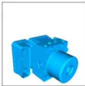
① ABS モジュール