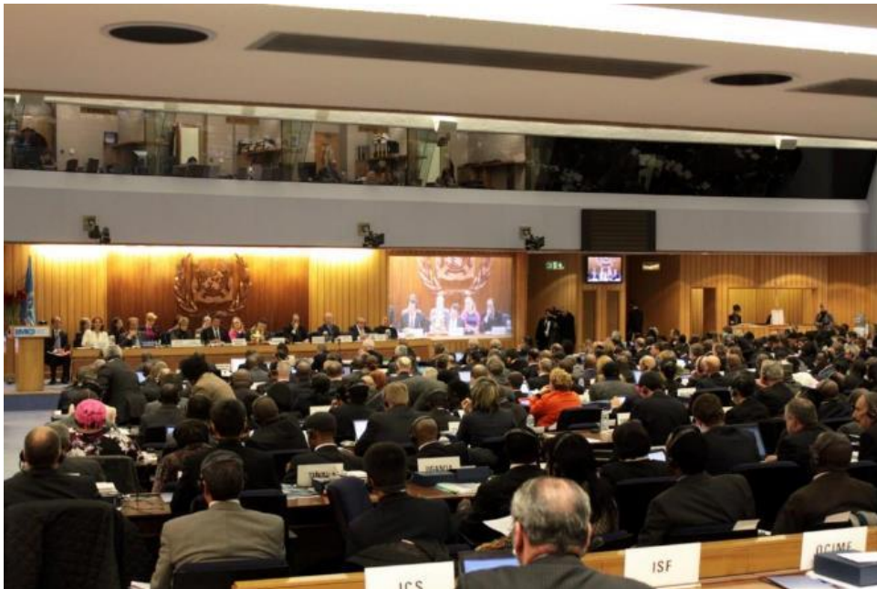
MEPCにおける審議の様子